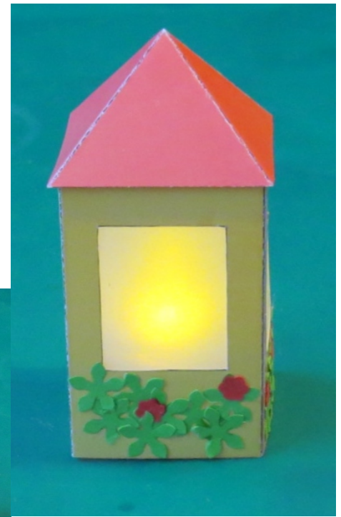
Bild: Laterne mit LED-Teelicht