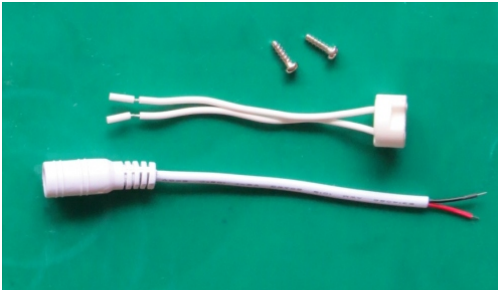
Schrauben, Fassung, Anschlußkabel

Nach dem Verlöten der Anschlußdrähte wurden die Drähte mit Heißkeber fixiert.